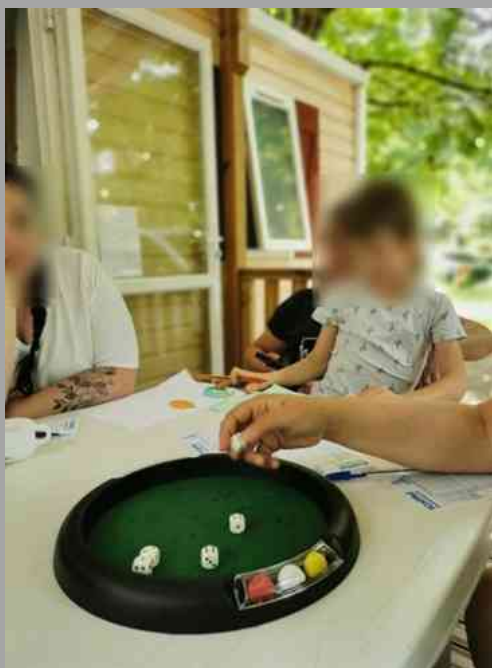
Simple mais efficace tout le monde se prend au jeu !