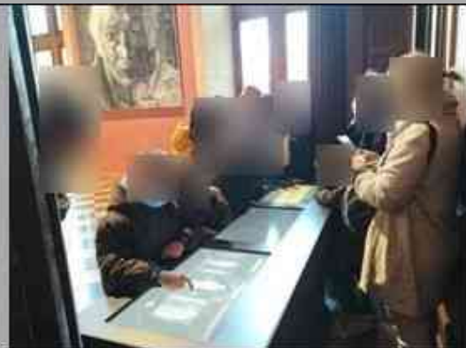
Musée des Beaux-Arts