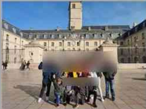
Tour Philippe Le bon

Nous sommes partis en camp pendant les vacances de la Toussaint. Le thème de ce camp était « patrimoine bourguignon ». Nous avons visité la tour Philippe le Bon. Celle-ci est dressée au centre du palais des ducs, la tour trapézoïdale construite au 15 ieme siècle présente un escalier en colimaçon de 316 marches. On a un panorama exceptionnel sur le vieux Dijon. Puis nous avons été au musée des Beaux-Arts. C'est un musée des plus importants et des plus anciens de France. Puis visite au jardin des sciences et des biodiversités, un espace pour comprendre l'histoire du vivant et de la biodiversité.