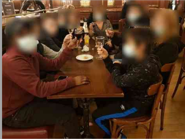
Dégustation d'un jus raisin !