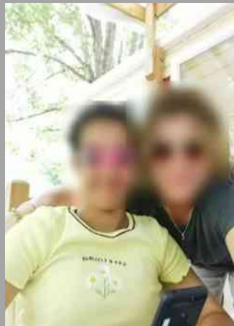
Beaucoup de rires et sourires