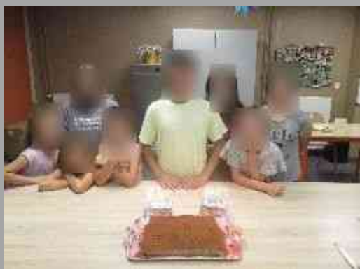
Arssalen 17 ans et oui déjà...

De nombreux anniversaires... rattrapage de l'été