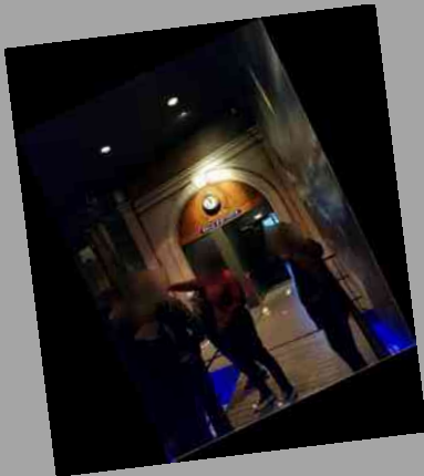
Découverte d'une locomotive de 1876