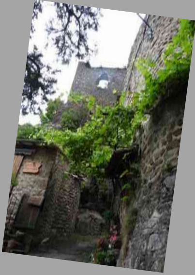
Ballade découverte aux alentours