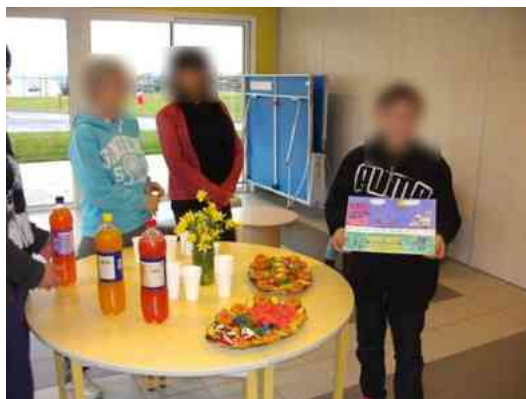
Concours de dessins....suite