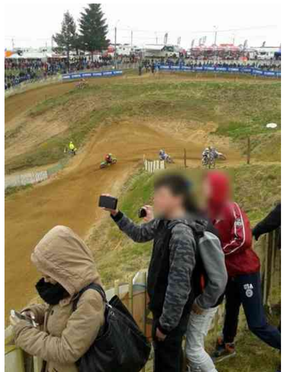
Terre des hommes

Chacun est revenu la tête et l'appareil photo plein de souvenirs !