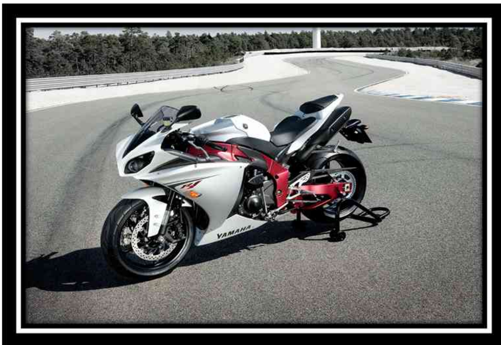
Yamaha R1 année 2012/2013 édition illimité

Pour faire des courses ou pour participer au Dakar.