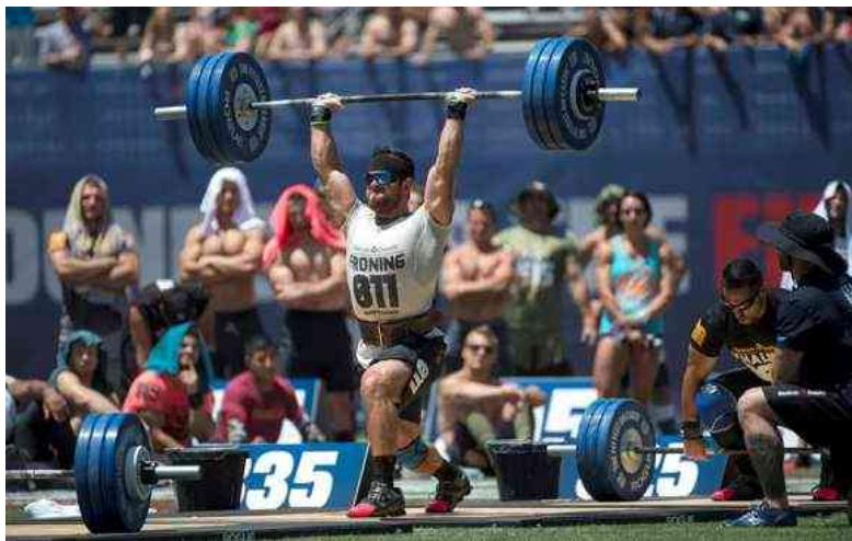
ici : Rich Froning effectuant un épaulé-jeté